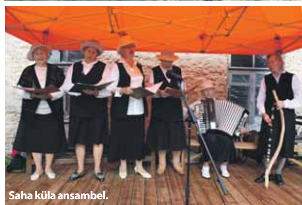
Saha küla ansambel.