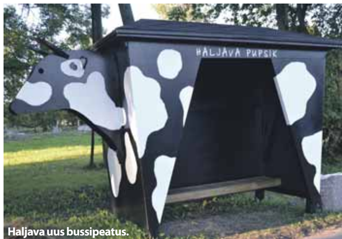
Haljava uus bussipeatus.